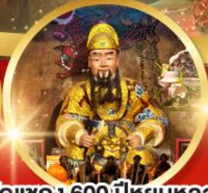
วัดแซก 600ปีหยุดหลง