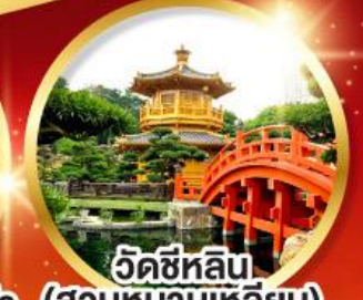
วัดซีหลิน (สวนหนานเท่หลิน)