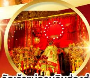
วัดเจ้าแม่กวนอิมฮ้องอำ