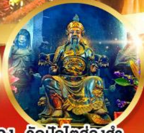
วัดปักไต้ฮ้องอำ