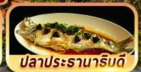
ปลาประรานาโรบตี