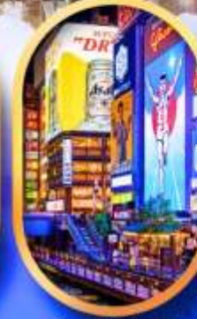
ย่านชิบะโฮชิ