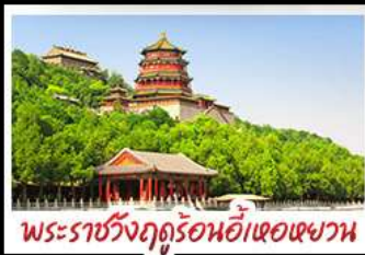
พระราชวังฤดูร้อนอ้าหอยวน

ท่าแพงเมืองจินค่านจวียงกวน - พระราชวังฤดูร้อนอ้าหอยวน สวนจิ่งอัน - วัดลามะ - โมลงร้านช้อป - โรงแรม 4 ดาว มือพิเศษ เปิดปีกกึ่ง สุกีมองโกล MICHELIN GUIDE ร้าน TAO TAO JU