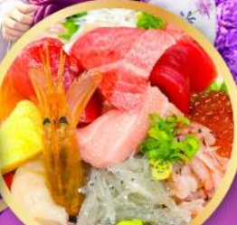
ตลาดปลาฮิมสุ คาชิโมะจิ

ถ่ายรูปเช็คอินวิวฟูจิ กับชมประตูโทเซคิจิ แชนมอน