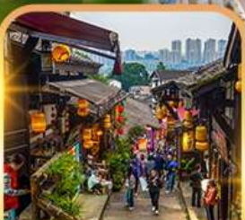
หมู่บ้านโบราณฉือชิว