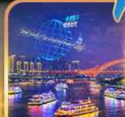
ส่องเรือแม่น้ำแยงซีเกียง