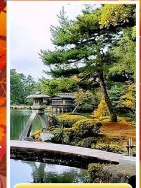
สวนเคนโระคุเอ็น

ออนเซ็น 3 คั้น นน.กระเป๋า 23 กก. 7Days 5Night