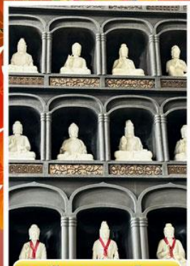
วัดไดชิซังเซอิไดจิ