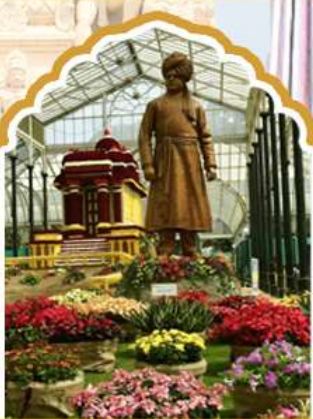
บังกาลอรั