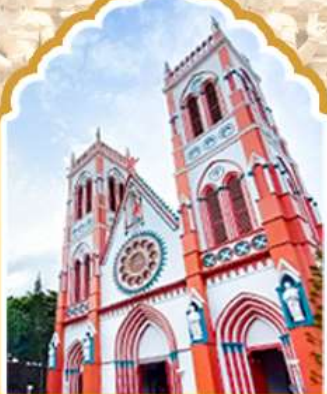
ปอนตีเซอรั