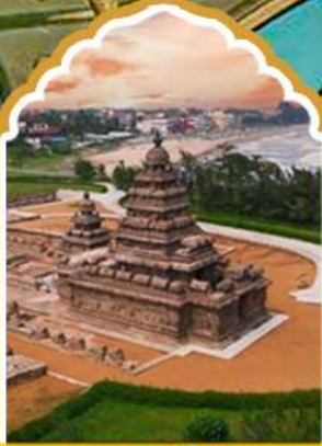
มทขาสลัปรัม