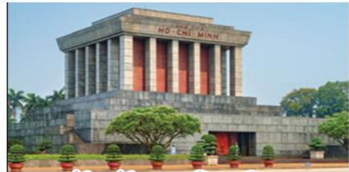
จัตุรัสบาติงห์