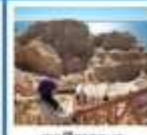
เขตพิศาจทะเล