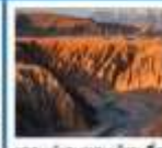
ถ้ำมรกตบนภูเขาไฟ