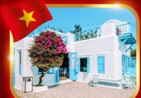
คาเฟ่สุดชิค ซานทรา มาริน่า