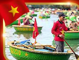
เรือกระด้ง หมู่บ้านกิมทาน