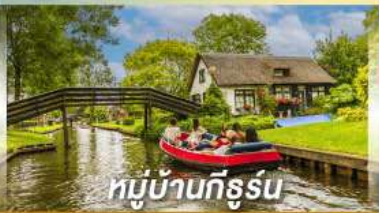
หมู่บ้านทึร์สุน