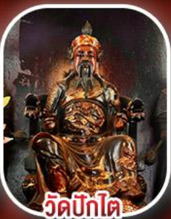
วัดปิกไต่