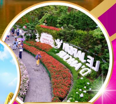
Le Jardin d'Amour