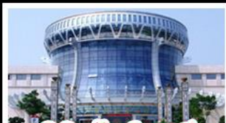
พิพิธภัณฑท์กวางสี

สวนสนุก FANTASYLAND - หมู่บ้านสไตล์ยุโรป พิพิธภัณฑท์กวางสี - ถนนคนเดินสามตรอกสองซอย ท่าเรือกิ่งจื่อ - ศาลเจ้าแม่กวนอิมพันกร เมมูพิเศษ อาหารกวางตุ้ง , สุกีชาบูหม่าล่า