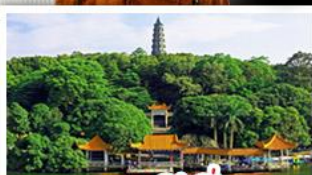
ภูเขาชิงชิว