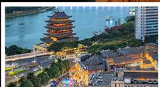
ถนนคนเดินสามตรอกสองซอย