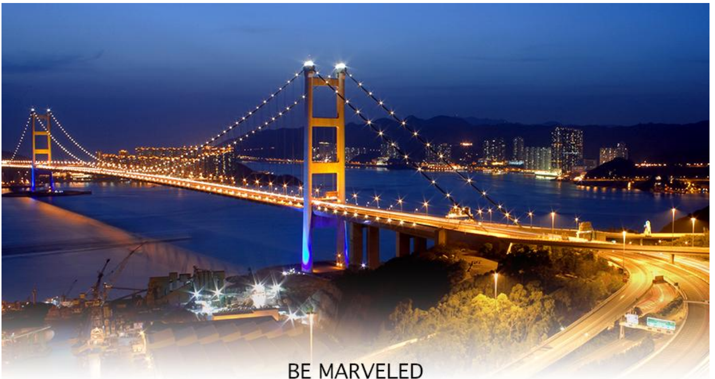
BE MARVELED สะพานแขวนชิงหม่า

17.40 น. เดินทางถึง สนามบินเซ็กแล็บก๊อก (CHEK LAP KOK INTERNATIONAL AIRPORT) เขตปกครองพิเศษฮ่องกง หลังผ่านพิธีการตรวจคนเข้าเมืองเป็นที่เรียบร้อยแล้ว รับกระเป๋าสัมภาระ เดินทางโดยรถโค้ชปรับอากาศ (เวลาที่ท้องถิ่นที่ฮ่องกง เร็วกว่าประเทศไทย 1 ชั่วโมง)