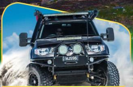
ขึ้นรถ 4WD สู้อีกกลางเทือกเขาคอเคซัส