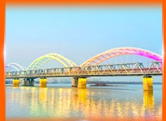
สะพานรถไฟผืนใจ