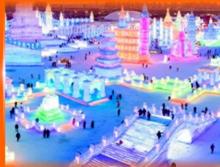
เที่ยว ICE & SNOW WORLD