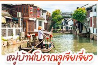
หมู่บ้านโบราณจูเจียงเจี๋ยว

สวนสนุกเซี่ยงไฮ้ดิสนีย์แลนด์ เต็มวัน (รวมรถรับ-ส่ง)