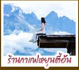
ร้านอาหารเขื่อนต้าอัน

ชมวิวภูเขาหิมะสวยที่สุด โรแมนติกกับแสงยามพลบค่ำ เที่ยวเมืองโบราณต้าหลี่ ลี้เจียง ป่าชา แซงกรี่ล่า ชมวิถีชีวิตของชนชนยูนนานและทิเบต พิสูจน์ความกล้าท้าเดินชมสะพานแก้วลี่เจียง • ซุปโปงเพลินที่ถนนคนเดินหนานผิงเจียง