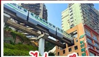
รถไฟทะลุคด