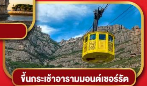
ขึ้นรถเข้าอารามมอนต์เซอรัลด์