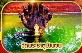
วัดพระธาตุบั้งพวน