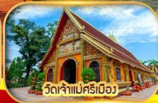
วัดจำแม่ศรีเมือง