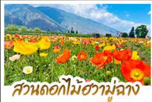
สวนดอกไม้ฮวามู่ฉาง