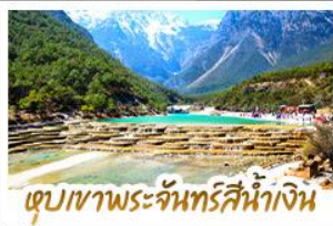
เขาดูวิวประจันตริทัศน์น้ำเงิน