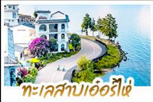
ทะเลสาบเอ๋อร์ไห่