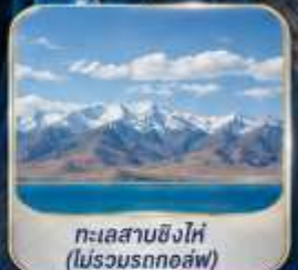
ทะเลสาบซิงไห่ (ไม่รวมรถกอล์ฟ)