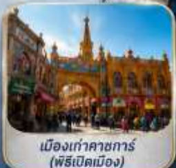
เมืองเก่าคาซการ์ (พิธีเปิดเมือง)