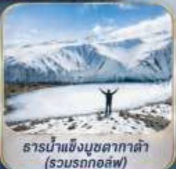
ธารน้ำแข็งมูซตาคาท่า (รวมรถกอล์ฟ)