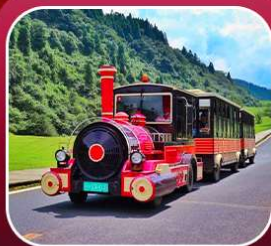
"อุทยานเขานางฟ้า"