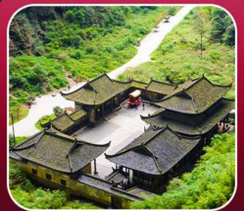
"อุทยานหลุมฟ้า"

T2G-CKG34(3U) The Best Chongqing...ฉงชิ่ง ต้าจู้ อุ้หลง เขานางฟ้า 5D 4N (3U)