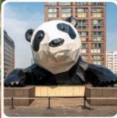
หมีแพนด้ายักษ์ป็นตึก