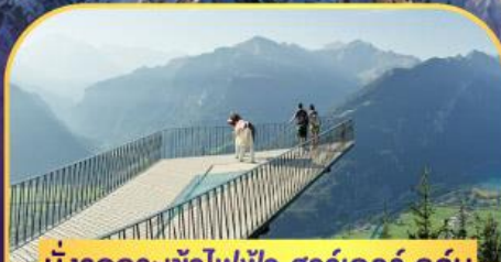
นั่งรถกระเช้าไฟฟ้า ชาร์เดอร์ ดูคัม