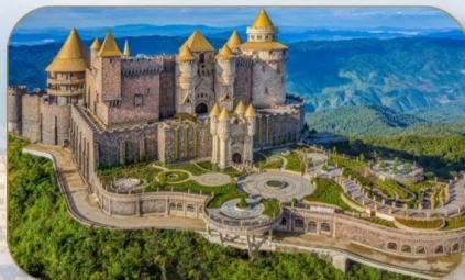
ปราสาทกษัตริย์

นำท่านนั่งกระเช้ายาวที่สุดในโลกได้รับการ บันทึกสถิติโลกโดย WORLD RECORD ประเภท NON STOP กระเช้านี้มีความยาว ถึง 5042 เมตร