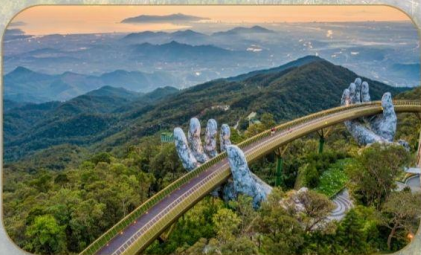
สะพานมือทองคำ