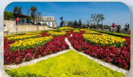
สวนดอกไม้ Le Jardin D'Amour