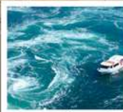
คลองเรือขมบ้านนาสุโตะ

วัดบึงฮอน / ตลาดกิงงะ / โบสถ์โทกาวานี่ (จุดชมวิว) / สะพานคินโตะเคียว เกาะมียาจิมา ศาลเจ้าอิตสึคุชิมะ / สวนอนุสรณ์สันติภาพฮิโรชิมา โดโกะออนเซ็น / ถนนโอโมเตะซันโด คมปีระซัง / ปราสาทนัตสึยามา กิจกรรมทำเส้นอุด้ง / สวนริทสึริน / สถานีรับทางคุรุคุรุมารุโตะ คลองเรือขมบ้านนาสุโตะ / ซุปบึงย่านชินโซบาชิ / ตลาดปลาคุโรเมง / ซุปบึงย่านอุเมดะ