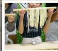
กิจกรรมทำเส้นอุด้ง