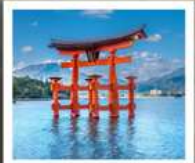
ศาลเจ้าอิตสึคุชิมะ