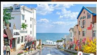
ถนนคอปเปลิ่งสาขาที่เปิด