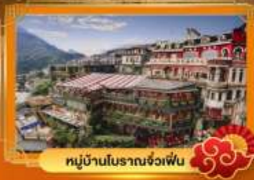
หมู่บ้านโบราณจ่งเฟิน