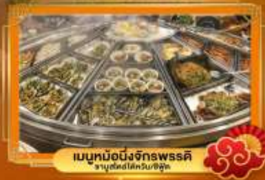
เมนูหม้อนึ่งจักรพรรดิ