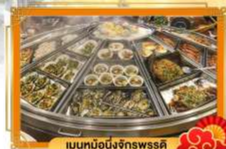
เมนูหม้อนึ่งจักรพรรดิ