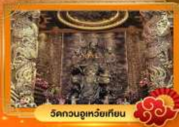
วัดกวนอู๋เหยี่ยวเทียน