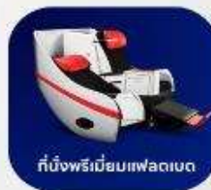
ที่นั่งพรีเมียมฟลอปเบด