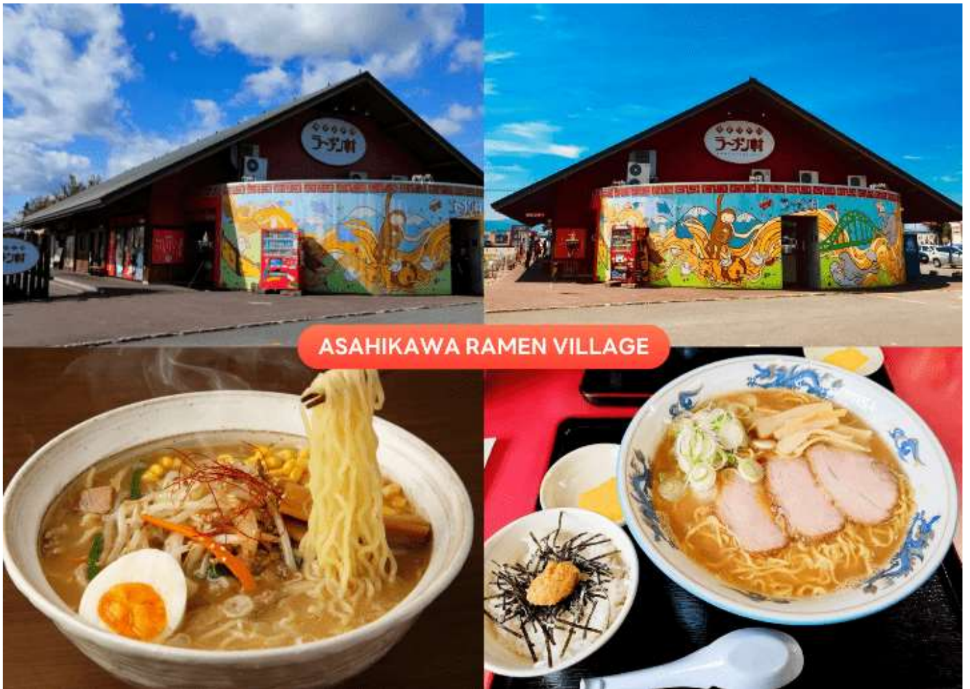
ASAHIKAWA RAMEN VILLAGE

นำท่านเดินทางกลับสู่ เมืองอาซาฮิดาวา (Asahikawa) เพื่อนำท่านสู่ หมู่บ้านราเมนอาซาฮิดาวา (Asahikawa Ramen Village) แหล่งรวมราเมนเจ้าดังของเมืองอาซาฮิดาวา ที่คัดสรรร้านยอดนิยมไว้ถึง 8 ร้านในที่เดียว เพลิดเพลินกับการลิ้มลองราเมนสูตรต้นตำรับฮอกไกโด สไตล์ซูโงยุที่ขึ้นชื่อเรื่องความหอมกลมกล่อม พร้อมเลือกชิมแต่ละร้านได้ตามใจ อีกทั้งยังมีโซนขายของที่ระลึก และพิพิธภัณฑ์เล็ก ๆ ให้ได้เรียนรู้ประวัติราเมนอีกด้วย