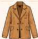
เสื้อแจ็กเก็ต หรือโค้ทตัวยาว