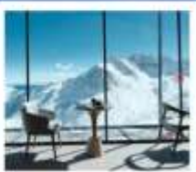
4860 COFFEE SHOP