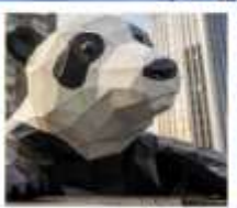
ห้าง IFS หนีเพนต้าบีนตัก