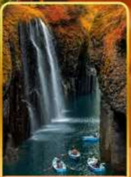
ทาคาจิโอะ(ไม่รวมสองเรือ)