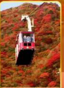
กระเช้าลอยฟ้าอุเซน