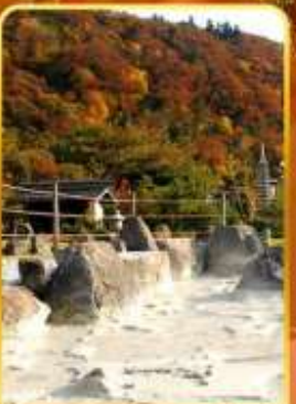
หุบเขานรกอุเซน

🌋 ออนเซ็น 2 คืน 🧳 นน.กระเป๋า 1 ใบ 23 กก 🌞 7Days 5Night