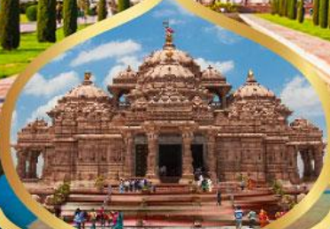
วิหารอักซาร์ดีม