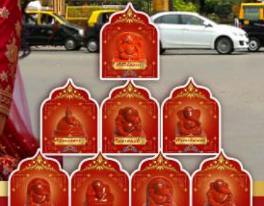
พระพิฆเนศ 8 องค์ เมืองปูณ