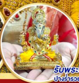
รับพระพิฆเนศวร ปางรำรอย ท่านละ 1 องค์